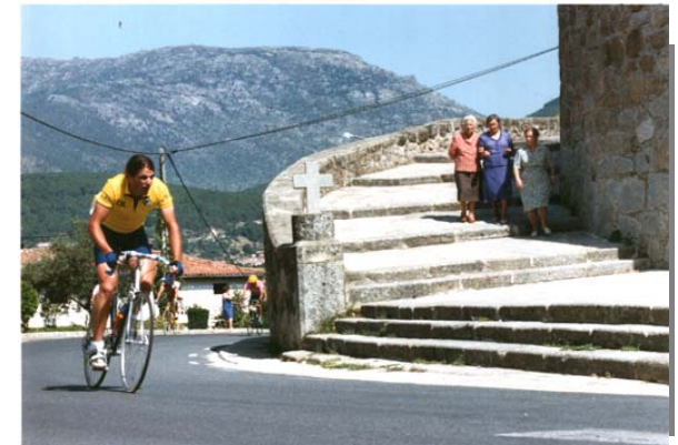
Posada Real de Esquiladores